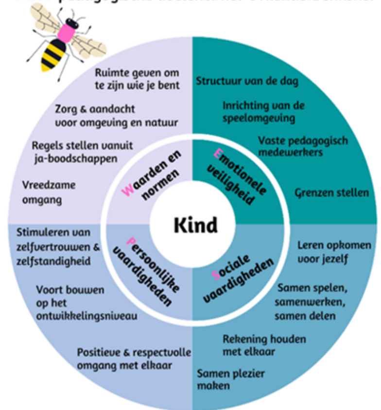
WESP pedagogische doelencirkel 't Kienderbènkske.